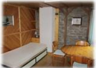
Betreuerbereich mit Schlafraum (3 Betten), Besprechungszimmer und separater Dusche/WC