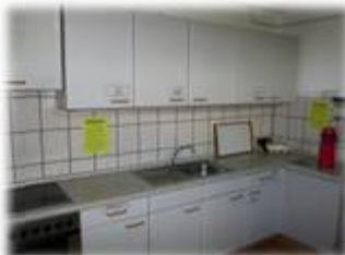
Küche mit Gas- und Elektroherd, Töpfen, Pfannen, Porzellan und allem was man zur Vorbereitung der Mahlzeiten braucht.