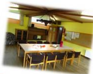
Gemeinschafts- und Essraum mit großer Schiefer-Tafel und Pinnwand